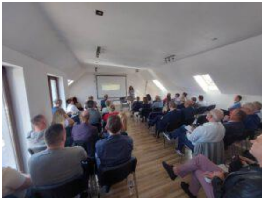
Spotkanie konsultacyjne w siedzibie LGD

Łącznie zorganizowano 16 spotkań poświęconych wyłącznie nowej LSR, w których wzięły łącznie udział 207 osoby . Zebrano też blisko 200 ankiet . Poszczególne spotkania przeprowadzono: