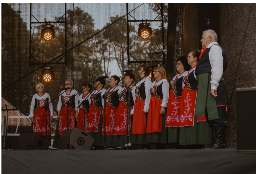
Pałucki Festyn Ludowy

Kwota dofinansowania: 15 742,39 zł, liczba uczestników: 5000 osób.