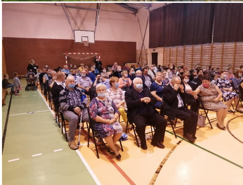
Granty realizowane przez KGW w Lubostroniu i Stowarzyszenie Tacy Sami