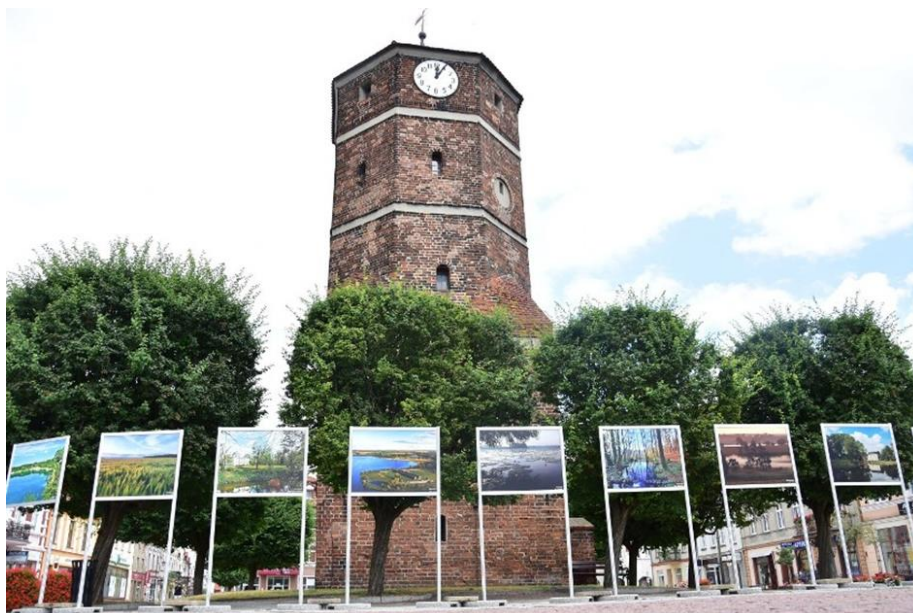
Zadanie Powiat zniński w obiektywie

Kwota dofinansowania: 1.400 zł, ilość uczestników to 14 osób.