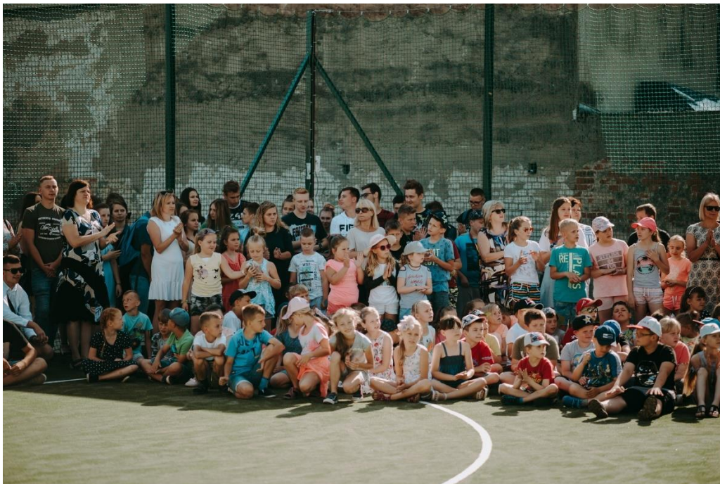
Otwarcie boiska wielofunkcyjnego w Łabiszynie (PROW 2014-2020)

Dzięki temu LGD ma wieloletnie doświadczenie w planowaniu i realizacji wielofunduszowej strategii, komplementarnym określaniu wsparcia w różnych programach, ocenie i wyborze operacji według różnych standardów i kryteriów programowych, realizacji projektów grantowych (we wszystkich trzech funduszach) i szerokiej aktywizacji mieszkańców, w tym osób w niekorzystnej sytuacji i osób zagrożonych wykluczeniem społecznym.