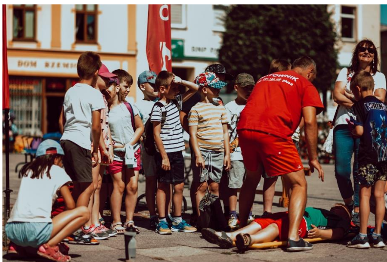
Pierwsza pomoc tu i teraz

Kwota dofinansowania: 10 000,00 zł, ilość uczestników: 250 osób.