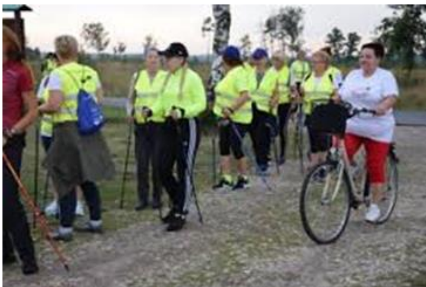
Zadanie Rajd Nordic Walking

Kwota dofinansowania: 3000,00 zł (2021 r.), 4000,00 zł (2020 r.), Ilość uczestników to około 200 osób.